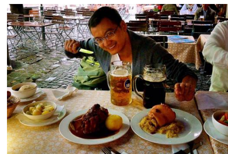
无法抵挡的诱惑-德国美食